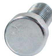
Megfognak 95%-ban elhasznált, lekerekített csavarfejeket.