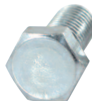
Károsítás nélkül kihajtanak új, lekerekített vagy megrozsdásodott csavarfejeket.